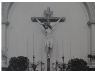
Venerable imagen del Santo Cristo, Señor nueve corazones, colocada en un altar lateral; ahora ocupa el retablo principal en el Templo de la colonia Escandón, Ciudad de México.

El 31 de julio de 1971, se erigió canónicamente la casa de Acapulco, Gro. Durante este año se aceptó la atención pastoral de la parroquia de san Francisco de Asís, en Apaxco, Edo. de México, y se erigió como Parroquia el templo del Espíritu Santo y Señor nueve corazones, en la Ciudad de México.