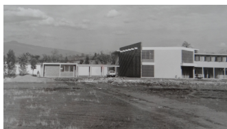
Casa destinada a los estudiantes de Filosofía, ahora sede del Centro de Espiritualidad Pasionista, Cuernavaca, Morelos.